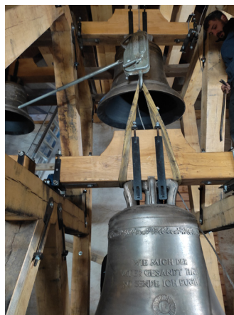
Bilder: E. Tomahogh