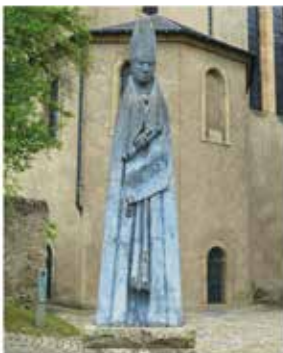
Statue des heiligen Willibrord in Echternach, Foto: Karl-Heinz Lenzner

anschl. GEFALLENENGEDENKEN AM KRIEGERDENKMAL (hinter der Kirche)