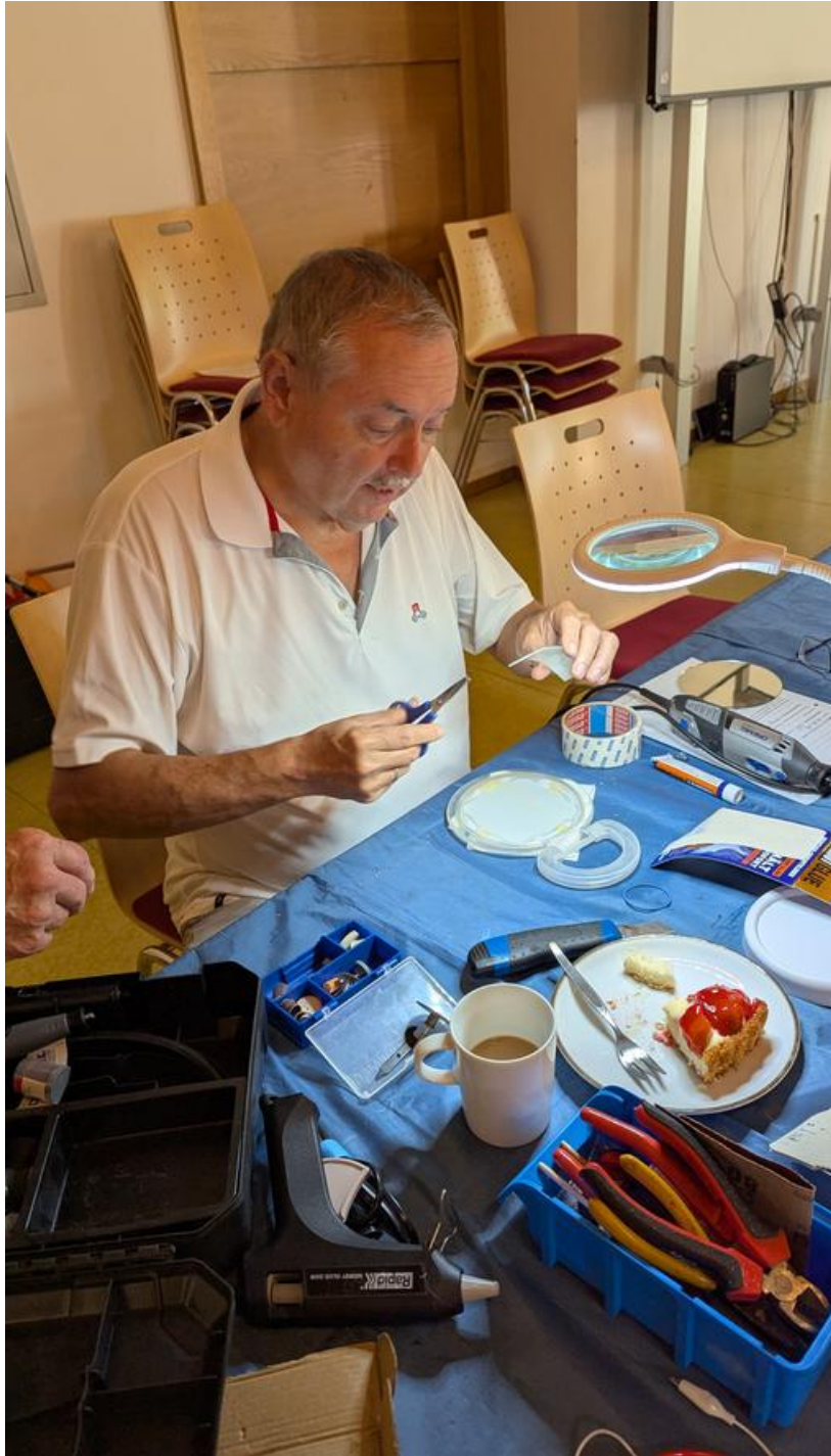
Kuchen und Kaffee gehören zum Reparatur-Café (Repair Café)