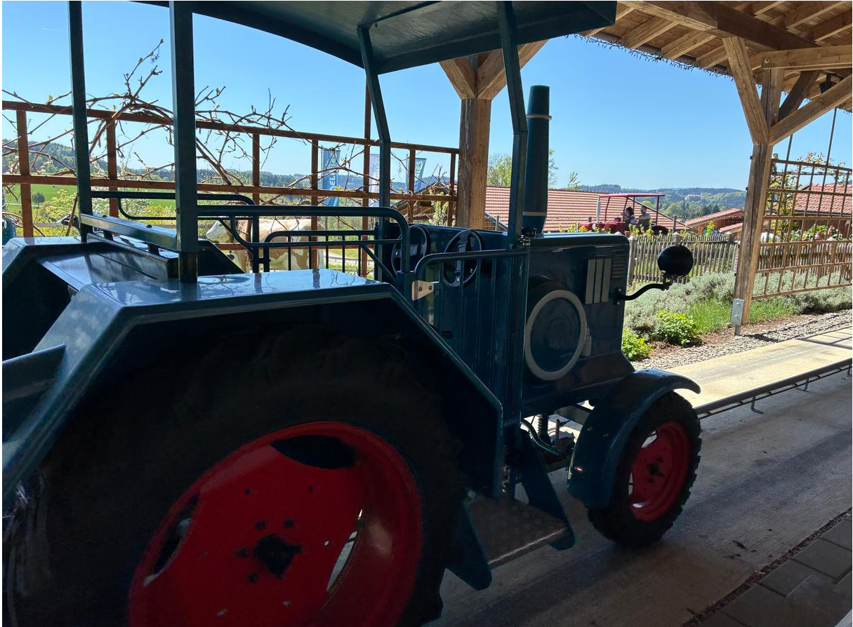
Die beliebte Traktorenfahrt