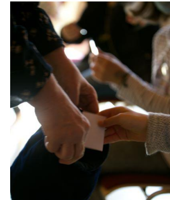
Pfarrei St. Konrad Regensburg