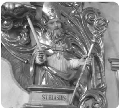
Pfarrkirche Niederolanz

Der heilige Blasius (Festtag: 3. Februar) war ein Bischof, der auch in schweren Zeiten Gott die Treue hielt und Menschen aus ihrer Not errettet hat. Mit dem Blasiussegen hoffen wir, dass auch wir in Notzeiten Licht sehen. Licht, das uns daran erinnert, dass wir auch dann im Licht Jesu sind, wenn wir krank werden oder Sorgen haben.