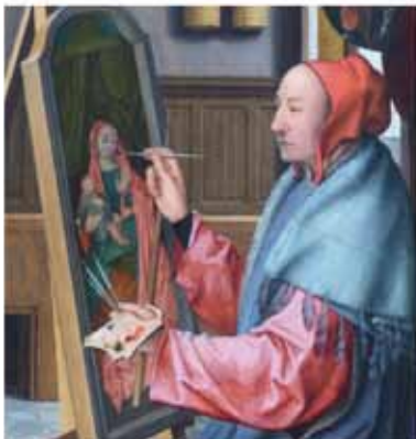
Quentin Massys, Der heilige Lukas malt die Jungfrau mit dem Kind, um 1520