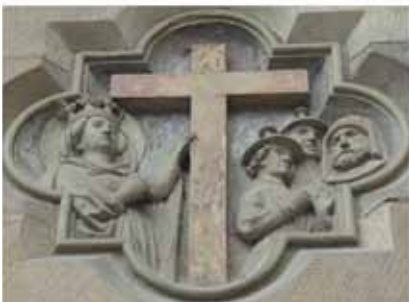
Vor der Kreuzerhöhung steht die Kreuzauffindung

Bis zum Zweiten Vatikanischen Konzil war die Kreuzauffindung ein Fest am 3. Mai. Der Tag geht zurück auf Helena, Kaiser Konstantins Mutter. Im Alter von über 70 Jahren folgte sie einem inneren Ruf nach Palästina, um dort greifbare Spuren des Lebens und der Passion Jesu zu suchen. Im Jahr 325 fand sie das Heilige Grab und das Kreuz Jesu. An der Fundstelle wurde am 14. September 335 die Grabeskirche eingeweiht, seit 629 feiert die ganze Kirche an diesem Datum das Fest Kreuzerhöhung.